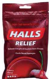
止咳糖, Halls® 数量:25