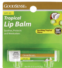
药用润唇膏, 0.15 盎司 数量:1