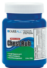
薄荷按摩膏, 3.5 盎司 数量:1